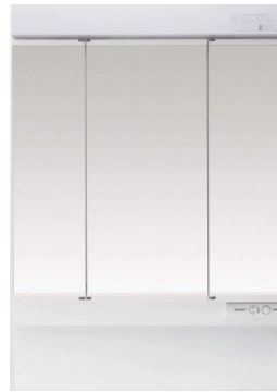
くま!シャット! (センターミラーのみ)