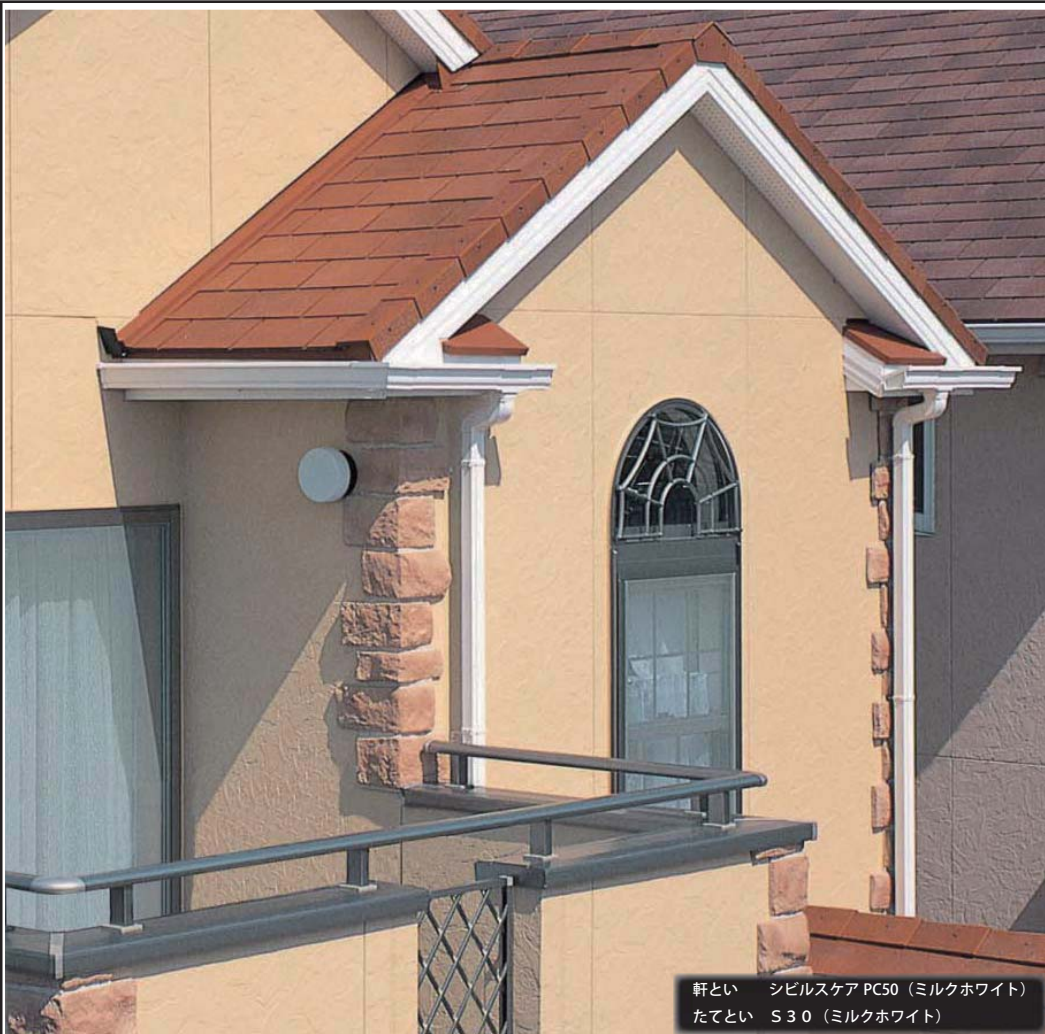
軒とい シビルスケア PC50 (ミルクホワイト) たてとい S30 (ミルクホワイト)