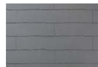
ココナッツ・ブラウン CC221G