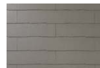
ウォルナット・ブラウン CC241G