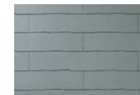
ウェザード・グリーン CC277G