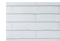
シルバー・ホワイト CC225G