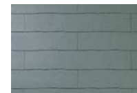
アイリッシュ・グリーン CC247G