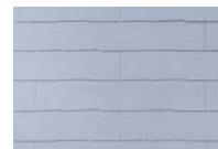
アイス・シルバー CC235G